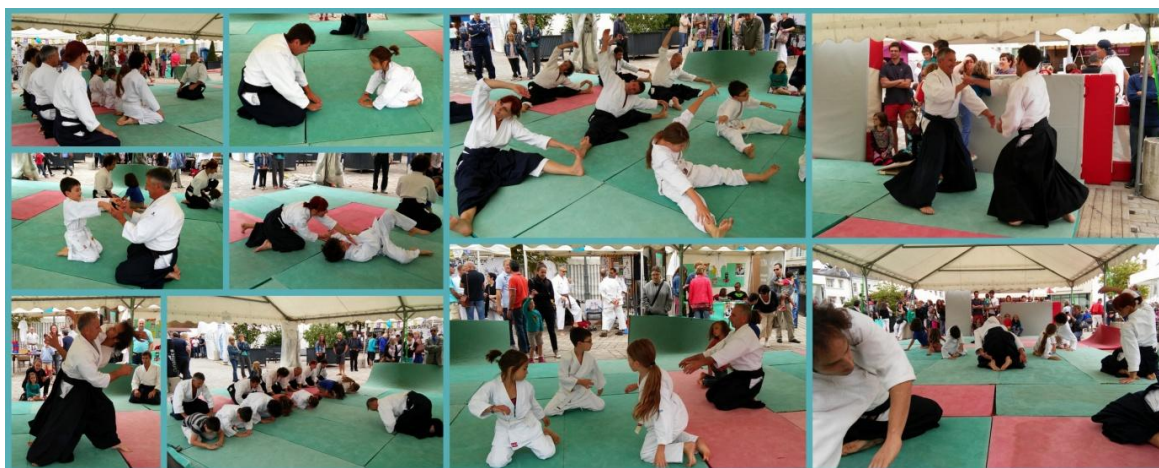
Démonstration à la fête du sport 2015

La saison dernière, une vidéo de l'événement a été réalisée et est visible sur le site du club : http://www.aikido-de-la-qatine.fr/?p=832