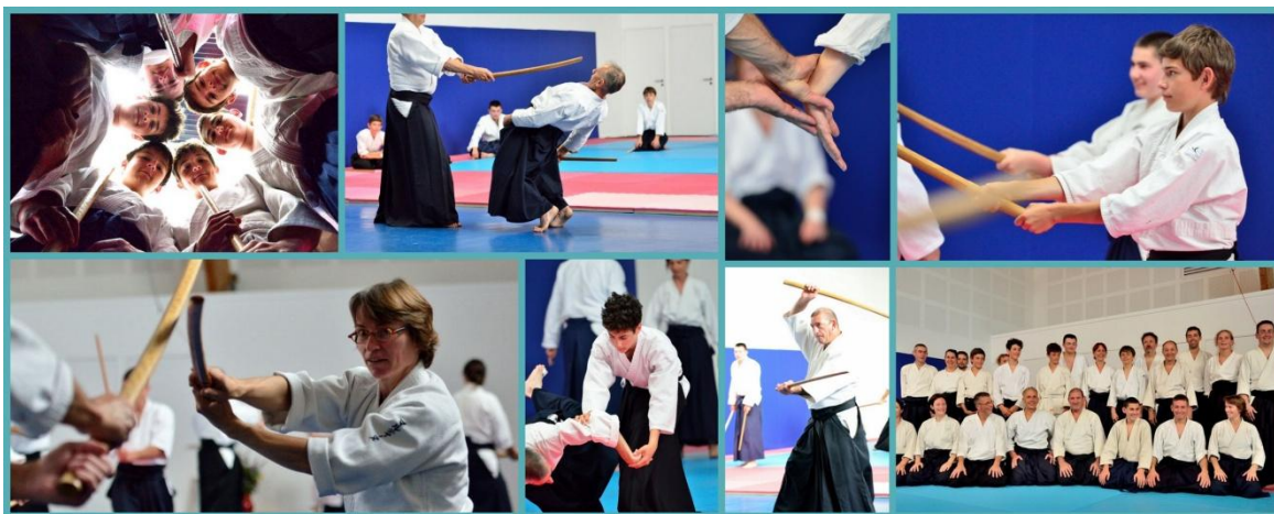
Stage à la Plaine-sur-Mer du 9 au 13 juillet 2016

C'était la 5 ème édition de ce stage au bord de la mer. Plus de 20 stagiaires, dont 6 adolescents, se sont réunis pour 5 jours de pratique intensive aux armes et à mains nues.