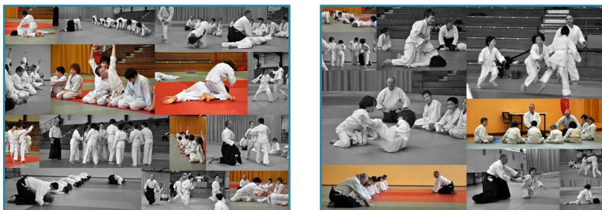
Cours enfants à Parthenay

Puis, de 15h30 à 16h30, c'était le tour des plus grands. Sept enfants de 8 à 13 ans ont pratiqué ensemble chaque semaine.