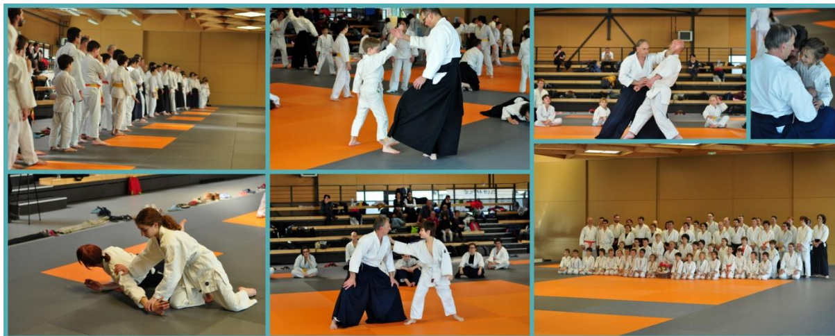
Stage intergénération aux Herbiers 20/03/16

http://www.aikido-de-la-gatine.fr/?p=1308