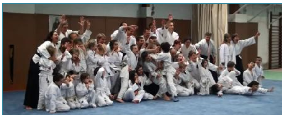
Stage intergénération à Cognac le 17/01/16

http://www.aikido-de-la-gatine.fr/?p=1301