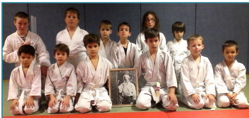
Cours enfants à Thénezay